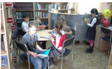
Юные читатели на открытии библиотеки.

Строители сделали внутреннюю перепланировку, заменили окна, двери, инженерные коммуникации. Библиотека была оснащена новой мебелью, специально разработанной и выполненной для нее. Оригинальное дизайнерское решение и техническое обеспечение сделали библиотеку культурным центром района. Она стала отвечать всем требованиям безопасности, появился отдельный вход. Ранее попасть в библиотеку можно было только через подъезд жилого дома. Строители сделали пандус с поручнями для людей с ограниченными возможностями». Обновленная, современная и комфортная библиотека стала прекрасным подарком жителям и значимым событием Года литературы в Иркутске.