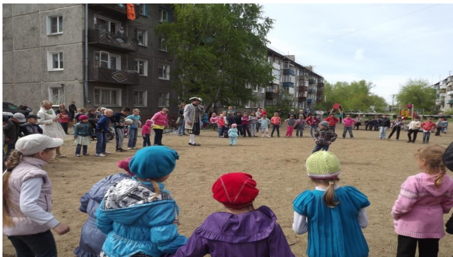
Праздник в честь Всероссийского Дня библиотек на ст. Батарейная.

Прошел большой праздник в честь Дня библиотек на детской площадке во дворе библиотеки. На нем выступили танцевальные коллективы и певцы школы искусств № 6, аниматоры провели большую развлекательную программу для детей и взрослых, в гости приехали руководители Ленинского округа, писатели и поэты Иркутска. Детям были вручены сладкие подарки от спонсоров.