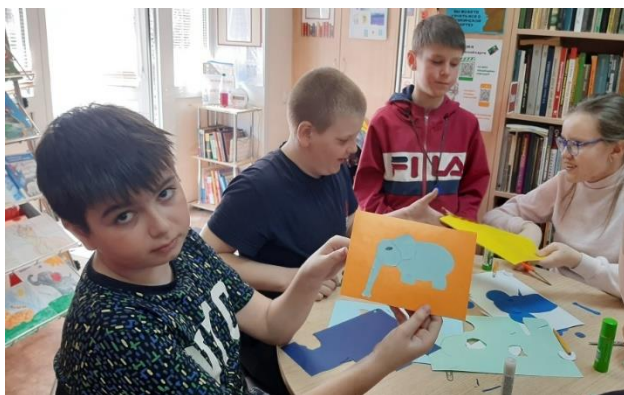
Участники кружка «Ассорти» - ученики младших классов