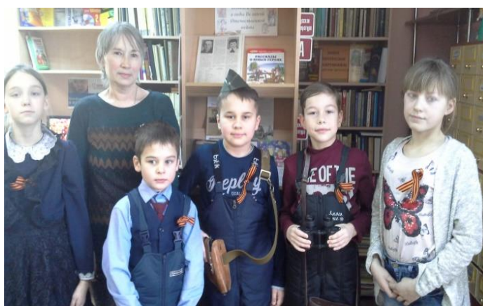
Мероприятие в библиотеке ко Дню Победы о юных героях.