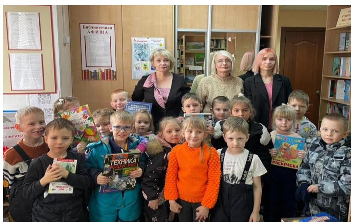
Средняя группа д/с № 36 в гостях в библиотеке.

Библиотека активно сотрудничает со школой № 36, детским садом № 36 и школой искусств № 6, которые расположены на станции Батарейная. С коллективами этих организаций были заключены договоры о творческом сотрудничестве. Библиотека на мероприятия приглашает иркутских писателей, организует творческие встречи.