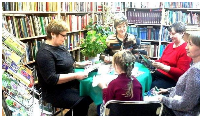
Заседание клуба «Цветочная академия».

Деятельность клуба направлена на объединение людей, которые испытывают потребность в постоянном общении, и единомышленников по интересам цветоводства, содействует развитию духовного и творческого потенциала, способствует формированию эстетического отношения к окружающему миру.