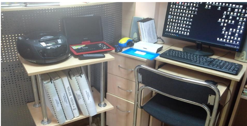
Библиотека № 1 - зона, оборудованная для читателей с ограничениями по здоровью.

В фонд библиотеки начинают поступать книги и журналы, напечатанные шрифтом Брайля.