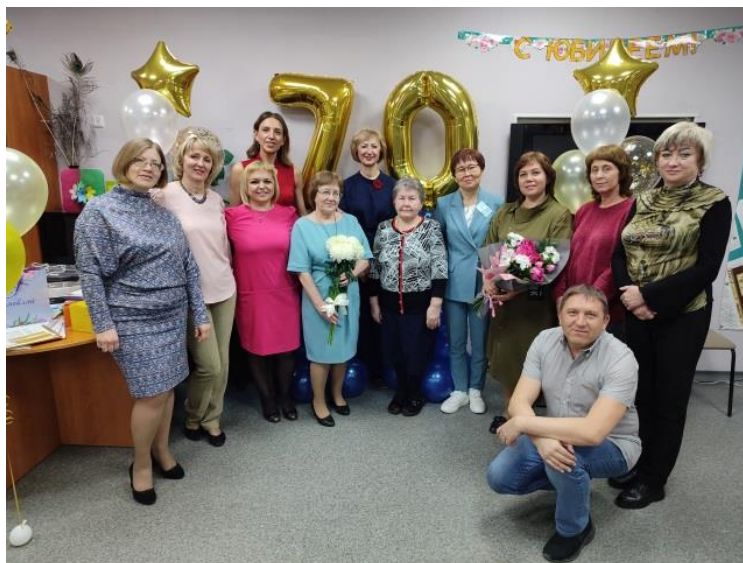
Коллектив библиотеки, 2022 г.

поздравительное приветствие прислал депутат Государственной думы Сергей Юрьевич Ген, а также поздравительный сертификат, по которому было приобретено и установлено оборудование – большой экран и проектор.