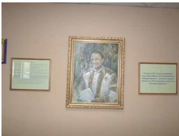
В холле библиотеки размещён портрет Евгения Александровича Евтушенко, автор Юрий Квасов - иркутский художник-портретист.