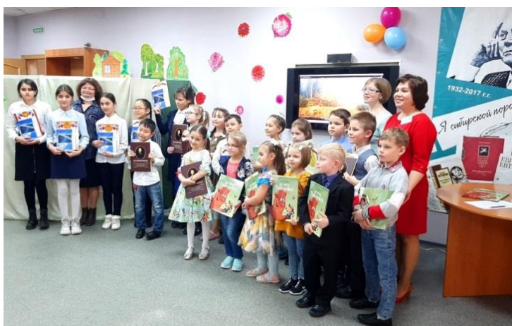
Фестиваль Иркутской поэзии.

2021 год был не простым. Сотрудники библиотеки, находясь на самоизоляции, не оставляли без внимания своих читателей, а работали дистанционно и проводили проекты и мероприятия – онлайн.