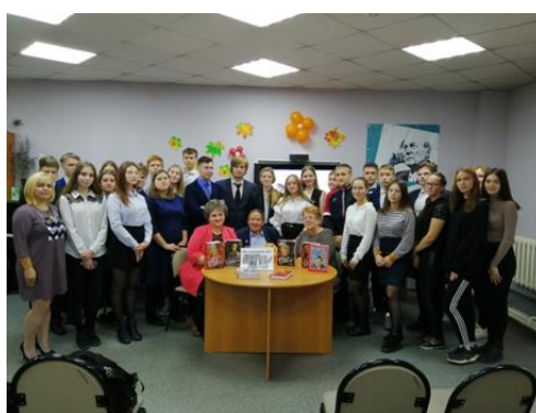
День рождения и День памяти поэта, 2018 г.