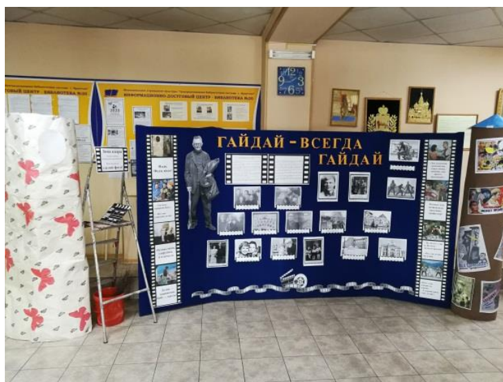
Фотозона к 100-летию Л. И. Гайдая

Библиотека активно продолжила работу по гуманитарно-просветительскому проекту «Пушкинская карта». В целях активного привлечения детей и молодёжи к изучению культуры и искусства была организована разноплановая программа. К Году педагога и наставника проведены мероприятия для всех возрастных групп. К 100-летию Л. И. Гайдая в течение года были проведены различные мероприятия: «Красота-то какая, лепота!», «Смешное кино – это серьезно!», а также оформлена годовая выставка-фотозона для всех посетителей библиотеки в холле.