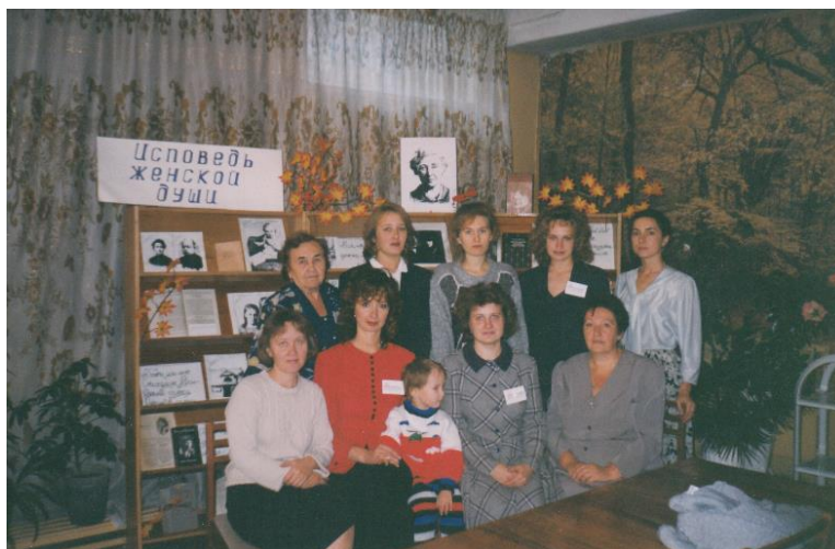
Коллектив библиотеки. 1997 год.