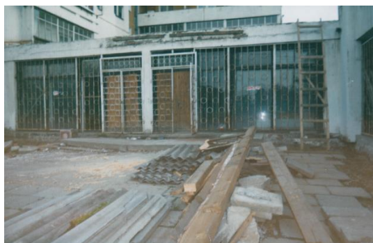
Период проведения капитального ремонта помещения библиотеки. 2006 г.