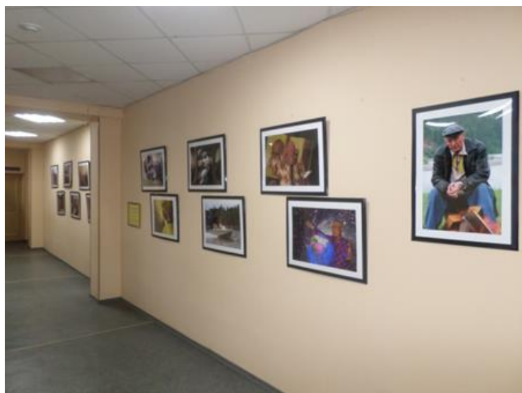
В коридоре библиотеки находится фотогалерея из 13 фотографий иркутского фотокорреспондента В. Г. Харитонов (формата А3), которые он передал в дар библиотеке в 2017 г.