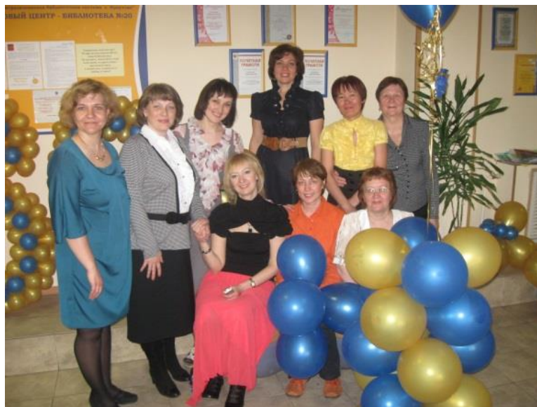
Коллектив библиотеки. 2012 г.

увеличились по сравнению с предыдущим годом. Район обслуживания посетителей также увеличился. Так, стали приезжать в библиотеку учащиеся средней общеобразовательной школы № 76 (Октябрьский округ, ул. 30-й Дивизии, 24), Лицея № 1 (Свердловский округ, ул. Воронежская, 2), а также участники художественного ансамбля из поселка Марково. Значительно активизировалась работа библиотекарей и с дошкольниками.