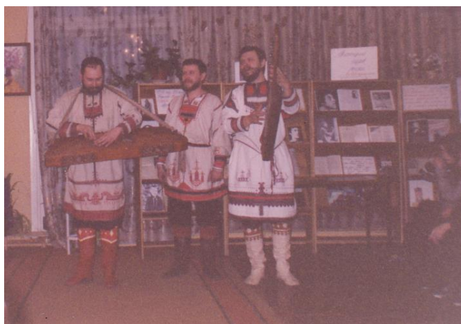
Артисты городского Театра народной драмы в библиотеке. «Рождественские посиделки». 1998 г.

Таким образом, библиотека становится массовой – для всех возрастных категорий читателей, при этом не меняя своего статуса, а закрепив данным преобразованием статус «Дома семейного чтения».