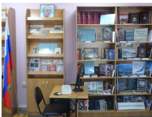
Экспонируются выставки произведений Е. Евтушенко.