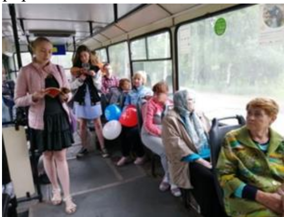
Пассажиры – участники флэш-моба в троллейбусе. 2019 г.

В июне, в преддверии Дня рождения поэта Евгения Евтушенко, сотрудники библиотеки провели библиотечный флэш-моб «Граждане, послушайте меня!», который был организован в троллейбусе маршрута «Сквер Кирова – микрорайон Юбилейный».