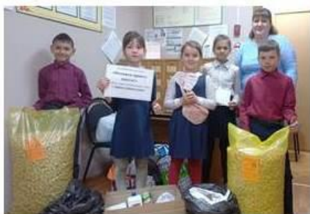
Благотворительная акция «85 добрых дел»

В правовом конкурсе на применение в повседневной практике библиотек СПС «КонсультантПлюс» библиотека заняла второе место.