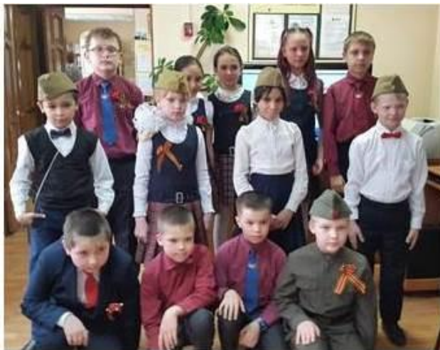
Конкурс чтецов «Мы о войне стихами говорим»

говорим...». Мероприятие прошло замечательно – все отлично подготовились, а поддержать конкурсантов пришли родители и одноклассники.