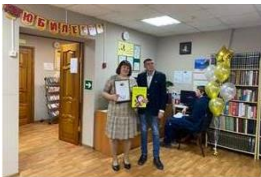
«Юбилей в кругу друзей» Библиотеке – 75 лет.

Кировская библиотека отметила 75 лет. Поздравить библиотеку собрались наши партнеры, читатели и коллеги. Слова поздравлений прозвучали от писателя Ю. Харлашкина, а украшением юбилейного вечера стали музыкальные номера в исполнении ансамбля «ЮниАкс», вокально-хоровой студии «Гармония», учащихся школы № 29 и воспитанников детского сада № 61.