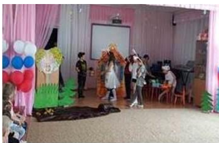
Проект «Открой мир со сказкой». Спектакль по сказке В. Сутеева «Мешок яблок». 2023 год

Разработан и успешно реализован проект «Открой мир со сказкой». В рамках проекта прошли интересные встречи с людьми творческих профессий, мастер-классы. Силами педагогов, родителей и учащихся 2 класса школы № 29 создан спектакль по сказке В. Сутеева «Мешок яблок».