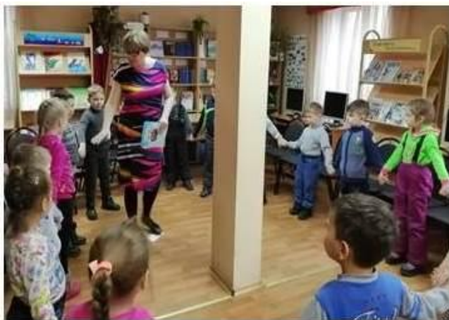
Фольклорный праздник «Масленица пришла, блины да мёд принесла!» для воспитанников детского сада №61.

В библиотеке проведен капитальный ремонт, полностью обновлена мебель, приобретено современное оборудование – 3 компьютера, телевизор, копировальная техника, принтер. Расширились коммуникативные возможности: телефон, электронная почта, интернет. Положительные преобразования повысили социальную значимость библиотеки, обеспечили приток новых читателей, увеличилось количество читателей школьного возраста. В связи с этим принято решение об открытии детского отдела.