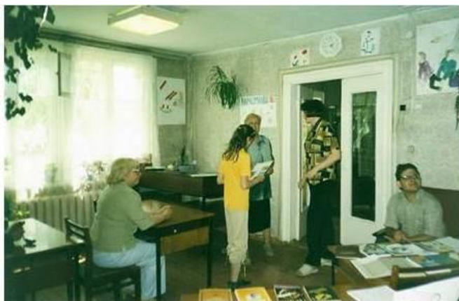
Участники антинаркотического марафона «Жизнь стоит того, чтобы жить!». 2005 год

В мае библиотека стала инициатором проведения антинаркотического марафона «Жизнь стоит того, чтобы жить!», и эстафету подхватили другие библиотеки округа.