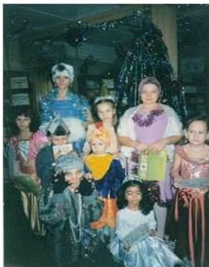
Семейный Новый год