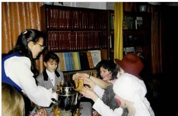
Клуб «Семь Я». Рождественские посиделки. 1998 год

Несмотря на сложное время, отсутствие финансирования, удалось найти средства для ремонта окон. Благодаря спонсорской помощи отремонтирована система освещения, приобретены подарки для участников семейного вечера «Рождественские посиделки», проведенного для членов клуба «Семь Я».