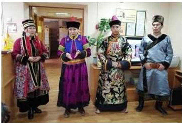
Мероприятие о традициях и обычаях бурятского народа. 2019 год

начал работу проект «Народы Прибайкалья», с целью познакомить ребят с культурой и традициями коренных народов Сибири. В рамках проекта проведены интересные и познавательные мероприятия: виртуальное путешествие, праздник национальных игр, громкие чтения. Вместе с библиотекарем школьники посетили «Центр культуры коренных народов Прибайкалья», где проходил конкурс бурятских национальных театров. Сотрудники Центра оказали неоценимую помощь в проведении проектных мероприятий.