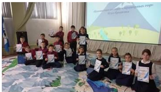
Напольная игра-бродилка «Путешествие по стране мраморных гор» для ребят из школы №29

Наши коллеги из Детской библиотеки г. Слюдянка приехали в гости и провели увлекательную и познавательную напольную игру-бродилку «Путешествие по стране мраморных гор» для ребят из школы № 29.