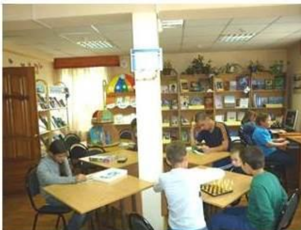
«Наш новый старый читальный зал»

В конкурсе на лучшую идею модернизации библиотечного пространства читального зала «Наш новый старый читальный зал» Кировская библиотека заняла первое место.