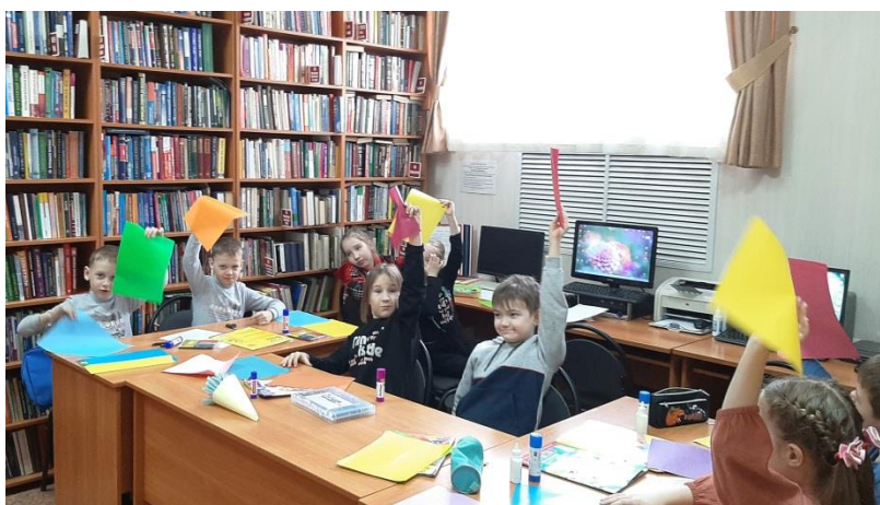
«Краски радости» – творческое занятие кружка «Палитра». 2023 год.

В 2023 году начал работу кружок детского художественного творчества «Палитра».