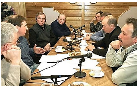
Встреча с иркутскими учеными.

Моя Иркутская область (1937–2007) / С. Гольдфарб [и др.]; худож. С. М. Григорьев ; редкол. А. Тишанин [и др.]; фот. Э. Брюханенко [и др.]. – Иркутск, 2007. –С. 674 : ил., цв. ил.