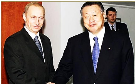
В. В. Путин и премьер-министр Японии Иосиро Мори.